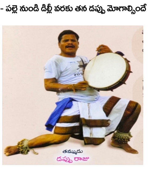
విశాఖపట్నం:- పల్లె పధం, జానపదం ఉద్యమపధం, విప్లవపధం చైతన్య పధం పాటకు